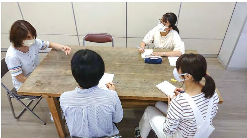
▲2021年度授業における活動見学の様子(仙台自主夜間中学)

就学できない方、義務教育を早期に離脱した方にも学びの場を提供するNPOや民間事業者が増えています。いつでも誰でも学ぶことができる場をつくることは、多様性を尊重する社会を実現する上で大切な活動の一つです。