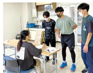
○避難所運営体験をする様子(防災部)