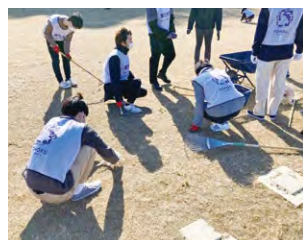
○震災遺構大川小学校の校庭の草取りをしている様子(ボランティア部)