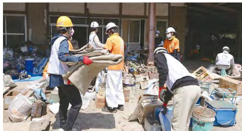
▲福島県沖地震で被災した方への支援(宮城県山元町)