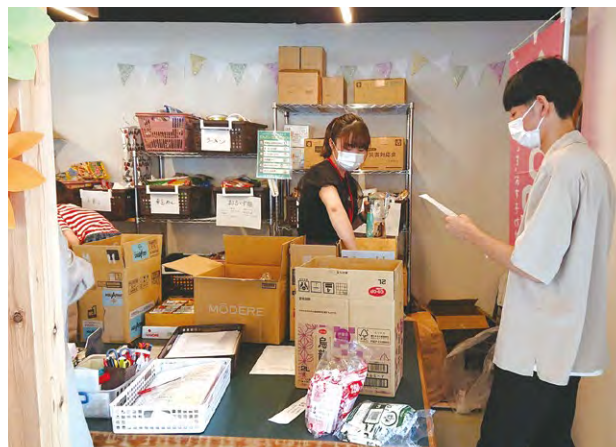
▲食糧を詰める学生ボランティアの様子(フードバンク仙台)

しかし、食糧支援だけでは社会的貧困の根本的解決には至らないため、社会全体としてどのように支え合いの仕組みを作っていくか、検討が重要となっています。