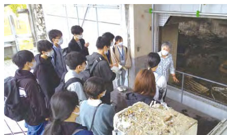
▲ 震災遺構を視察する様子(石巻市門脇小学校)

被災経験やそこからの思い等を伝える「語り部」の皆さんは、聞き手の感情を揺さぶり、伝承への関心や防災意識を高める力を持ってきました。ただし被災を経験していても「語り部」として発信できる人は限られており、高齢化も進行しています。そこで誰しもが「語り部」として経験を発信できる環境づくりや、語り部の経験を次の世代が伝える「語り継ぎ」を進めることも重要となっています。