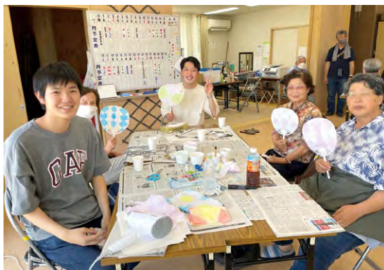
▲ サロン活動の様子(荒井東市営住宅)

各地の住宅では、健康体操から季節ごとのイベントまで、入居者自身によるコミュニティづくりが試みられてきました。しかし時間の経過とともに多くの課題が浮上しており(入居者の入れ替わり、担い手の高齢化、活動のマンネリ化、コロナ禍での活動制限など)、新たな交流の場やボランティア等と連携した活動の活性化が期待されています。