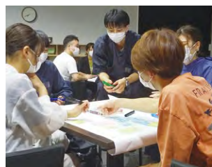
○先輩たちが行ってきた活動を振り返る勉強会の様子(災害救援部)