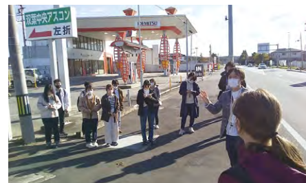
▼ タウンツアーの様子(福島県双葉町)

「東日本大震災について知りたい」と思った学生さん、ぜひ、沿岸部にお越しください。そこで語り部さんの話を聞いて心を動かされ、この話を「誰かに話したい！」と思ったら、それはもう「語り継ぎ」の一步です。