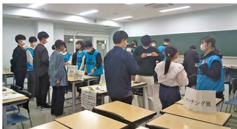
▼災害ボランティアセンター運営サポート研修の様子(学内)

災害後は生活や地域の立てなおしに向けて膨大なニーズ(困りごと)が発生し、支援の「もれ・むら」が生じやすくなります。そのなかで、それぞれの人・地域のニーズに対応した支援、悩みや気持ちを吐きだしやすい場づくり(例、足湯の提供)といった活動が重要となっています。